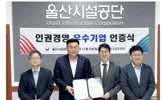
<인권경영 우수기업 인증 수여식(울산시설공단, '23년 11월)>