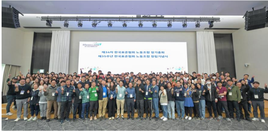
2023 KSA 노사화합의 날 (2023.10.13)