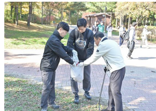
KSA 노사한마음 ESG 걷기(2022년)

한국표준협회는 에너지절약, 에너지 이용효율 향상 및 신재생에너지 보급을 촉진하고 에너지 저소비형 경영체계 구축을 위한 에너지절약추진위원회를 구성(2009년)하였습니다. 임직원이 참여하는 플로깅(Plogging) 활동인 'KSA 노사한마음 ESG걷기'로 친환경 활동과 노사화합을 동시에 추진(2022년)하였으며, 또한 본사 직원 휴게공간에 '다회용컵 순환 서비스'를 도입(2024년)하여 탄소중립과 플라스틱 사용 저감 실천을 위하여 노력하고 있습니다.