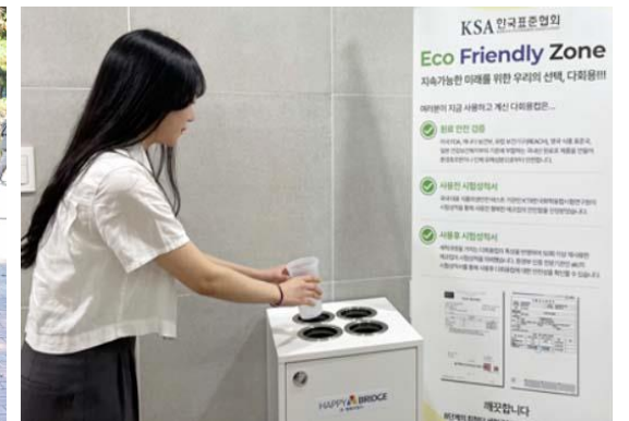
다회용컵 순환 서비스 도입(2024년)